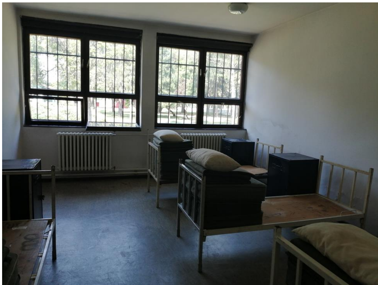
Дисциплинска просторија у једној од посећених касарни

ЦПТ препоручује да се одмах предузму кораци за побољшање приступа природној светлости у дисциплинским ћелијама. Ћелија која тренутно нема приступ природном светлу не сме се више користити док се такав приступ не обезбеди. 17