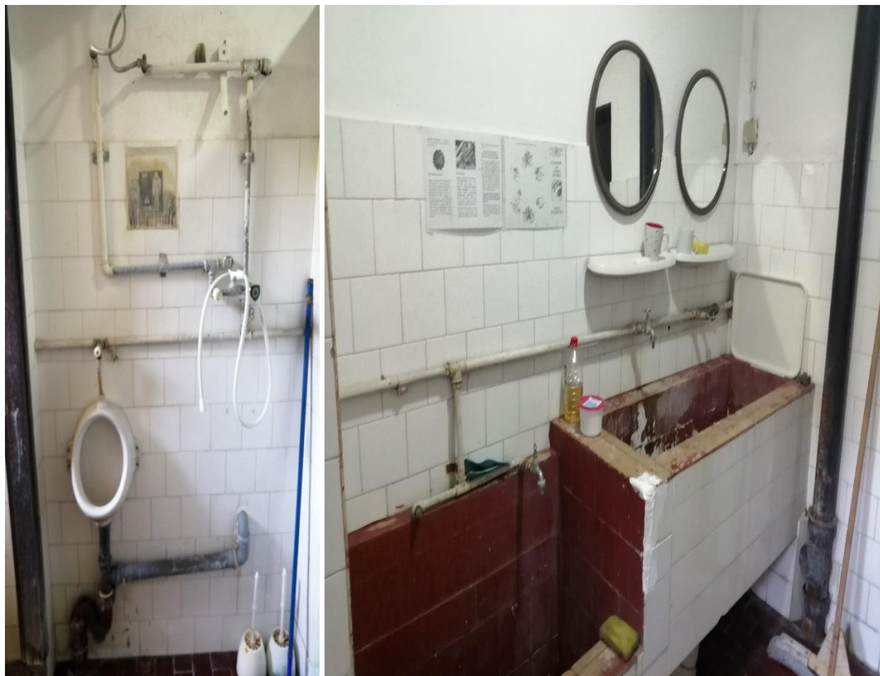
Тоалет који користе санкционисани војници у једној од посећених касарни

купатила налазе у другом објекту. Санитарне уређаје би у неколико касарни 21 требало заменити, јер су затечени уређаји били у лошем стању.