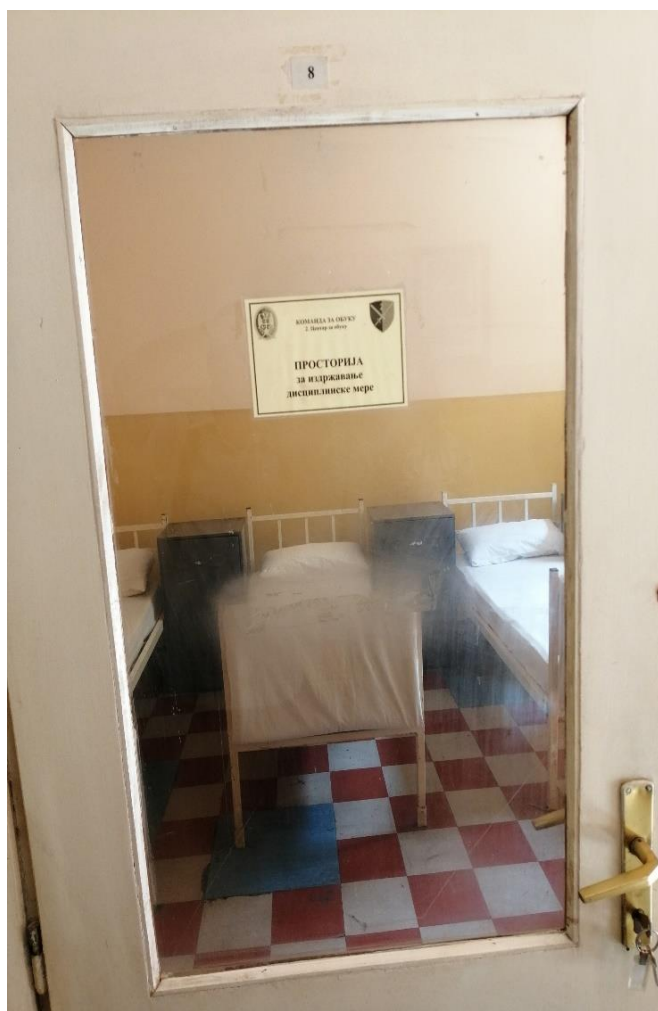
Улаз у дисциплинску просторију у једној од посећених касарни

Начин извршења санкције је ближе уређен Правилном о војној дисциплини, а детаљније регулисан упутствима које доносе команданти јединица и који постоје у свакој посећеној касарни. Упутства се састоје од наређења о формирању просторије, дужности надзорника или других старешина у погледу просторије и у односу на санкционисаног војника, распореда дневних активности и књига евиденције. У највећем броју случајева ова упутства су означена одређеним степеном тајности.