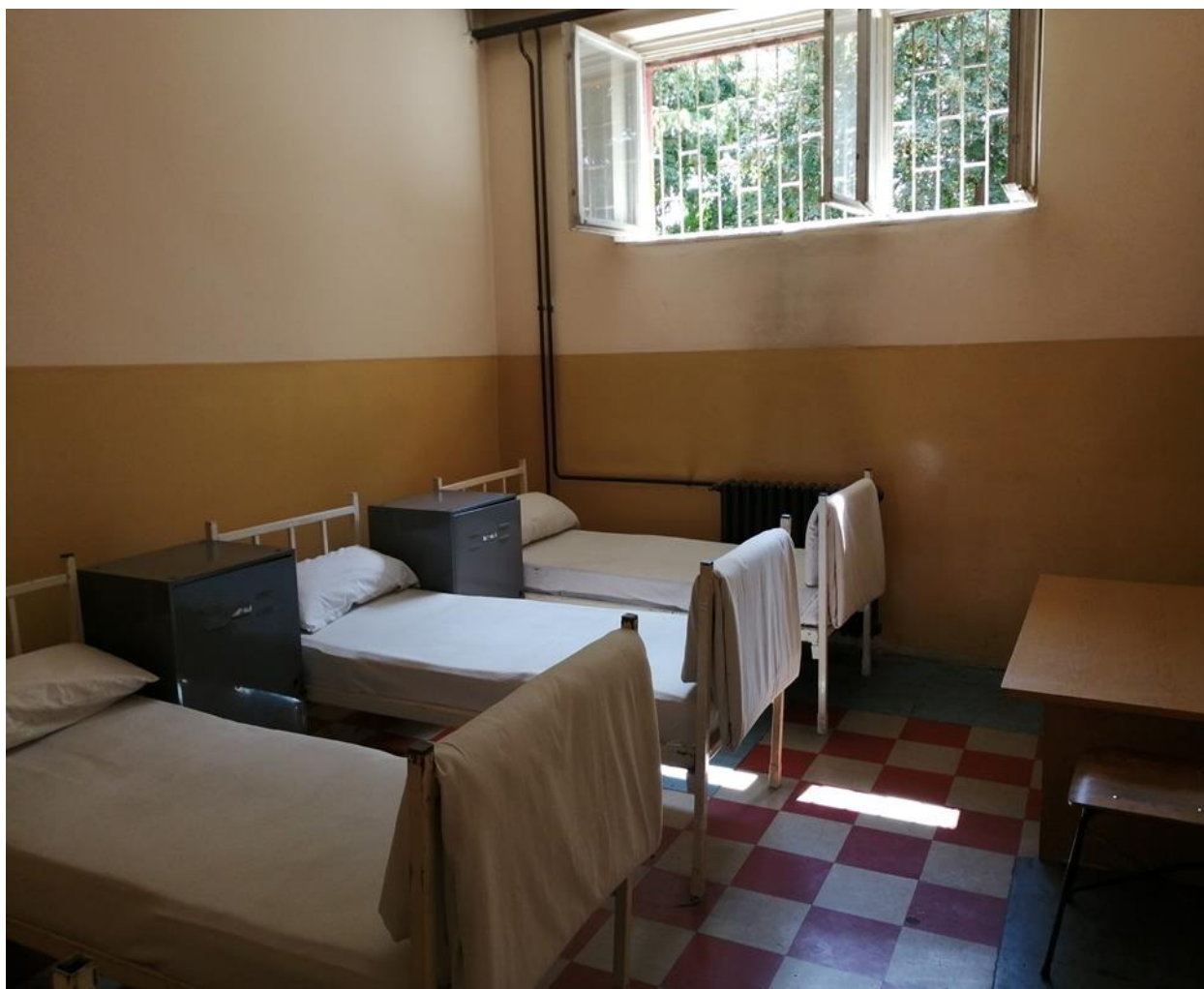
Дисциплинска просторија у једној од посећених касарни

Услови у дисциплинским просторијама се не разликују битно од просторија у којима су смештени остали војници, у шта се НПМ уверио обиласком спаваоница у појединим касарнама. Колико је НПМ могао да примети, уочљиве разлике су да се на прозорима и вратима или уместо врата већине дисциплинских просторија налазе решетке, као и да су предвиђене за мање војника.