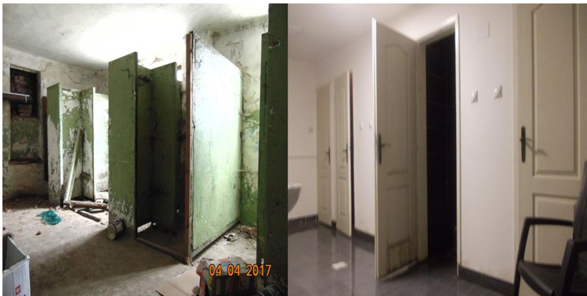
Подрум Прихватног центра пре и после реновирања

Мигранти углавном чекају могућност да наставе свој пут преко Мађарске до развијених земаља Европе. Сви се налазе на списковима за пријем у Мађарску, али од краја прошле године није било информација да је потребно да се нека породица или појединац припреми за наставак пута. 5