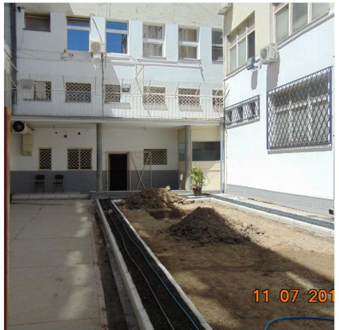
ОКРУЖНИ ЗАТВОР У СМЕДЕРЕВУ