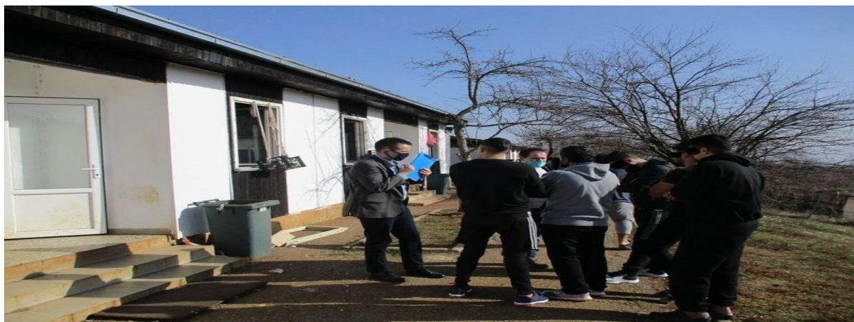
разговори са мигрантима затеченим у ПЦ Пирот

Већина миграната углавном улази у Србију из Северне Македоније, а уласци из Бугарске су се значајно смањили у претходном периоду. Тако, нико од мигранта са којима је НПМ обавио разговоре није у земљу ушао из Бугарске. Као што је раније наведено, НПМ је током посета прихватним центрима од појединих миграната са којима је разговарао примио наводе о недозвољеном протеривању, које је понекад праћено и физичким насиљем. 18 Ове оптужбе се углавном односе на службенике страних земаља. Истовремено, мигранти нису знали да прецизно објасне време и место догађаја ни наводне учиниоце, а наводне повреде нису документовали нити су биле видљиве када је са њима о томе разговарано.