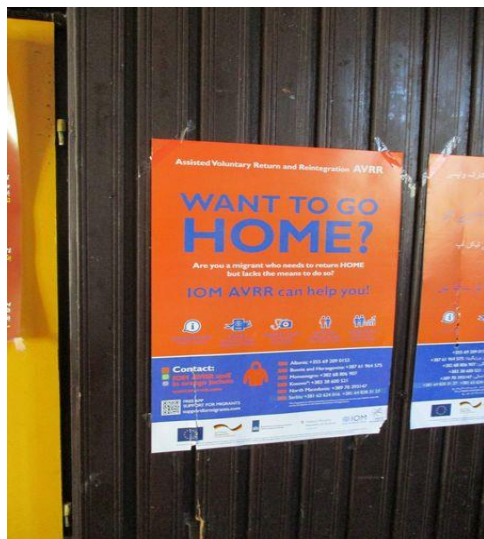
информације о асистираним добровољном повратку

Полицијски службеници су имали бројне обуке о поступању према осетљивим или посебно рањивим групама миграната, као што су обуке за поступање према малолетницима и према жртвама трговине људима. У седишту РЦПГ Бугарска 41% радно ангажованих чине жене, а у станицама граничне полиције је око 20% жена. НПМ похваљује чињеницу да се предузимају континуиране обуке полицијских службеника за поступање према рањивим категоријама лица.